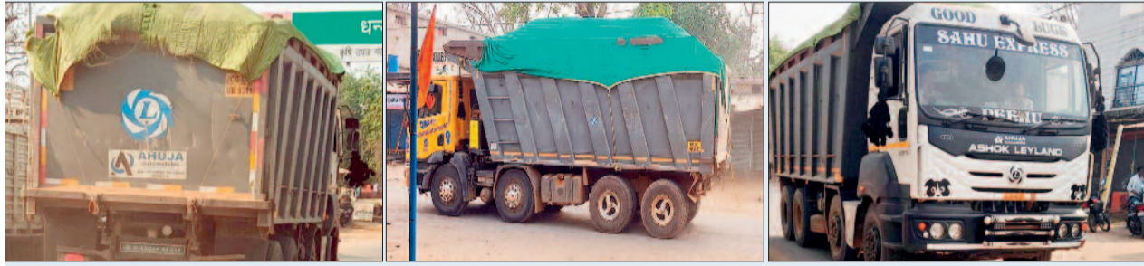
उनकी आंख खुलने से पहले ही यहां तस्कर उनकी आंखों में धूल झोंक रहे हैं। ग्रामीणों ने बताया कि तेंदूकोना थाना अंतर्गत बुंदेली चौकी साइड से प्रतिदिन सुबह 5 बजे से 9-10 बजे तक 8-10 हाइवा रेत भरकर भुरकोनी रोड से निकल कर तेंदूकोना होते झलप की ओर से निकाला जा रहा है।

जिले के तेंदूकोना थाना क्षेत्र के बुंदेली चौकी अंतर्गत लिलेसर घाट से रोजाना अलसुबह रेत का अवैध उत्खनन किया जा रहा है। यह वाहन भुरकोनी रोड से होते हुए तेंदूकोना और झलप की ओर रवाना हो रही हैं। बता दें कि लिलेसर घाट से किए जा रहे अवैध उत्खनन पर कुछ माह पहले कलेक्टर के निर्देश पर कार्रवाई की गई थी। लेकिन, अवैध उत्खननकर्ताओं के होसले इस बुलंदी पर हैं कि जिले के आला प्रशासनिक अफसर के निर्देशों को धटा बताते हुए जोंक नदी और मचका नाला से रेत की खुलेआम अवैध उत्खनन और तस्करी की जा रही है। बता जा रहा है कि जब अफसर गहरी नींद में होते हैं अथवा