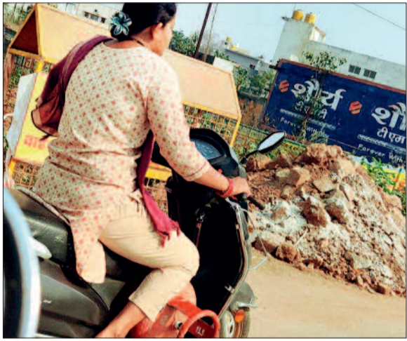
कामकाज प्रभावित हो रहे हैं। आपूर्ति होने के बावजूद स्थिति अब यह है कि महिलाएं सिलिंडर लेने पहुंचने लगीं हैं।

रसोई में आए ईंधन संकट से जूझ रही महिलाएं अब सिलिंडर की कतार में भी जूझ रही हैं। हालांकि, सिलिंडर की कोई समस्या नहीं है। लेकिन, ईरान और अमेरिका युद्ध के चलते खाड़ी देशों में ईंधन की आवाजाही में हो रही समस्या के मद्देनजर लोग सिलिंडर को लेकर भय खा रहे हैं। जबकि, होम डिलीवरी जारी होने के साथ अब आपाधापी में भी कमी आई है। जिले में इन दिनों रसोई गैस सिलिंडर की किल्लत ने आम लोगों की परेशानी बढ़ा दी है। स्थिति यह है कि समय पर गैस सिलिंडर नहीं मिलने से घरेलू