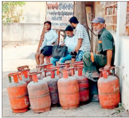
गैस एजेंसी संचालकों की मर्ग तो घरेलू गैस की पर्याप्त आपूर्ति हो रही है। वहीं, कॉमर्शियल सिलिंडर की आपूर्ति पूर्व में 20 फीसदी जारी की गई थी। लेकिन, अब इसे 30 फीसदी करते हुए केवल मेडिकल और एजुकेशन सेक्टर के लिए इसे बढ़ाया गया है। होटल और दुकानों में कॉमर्शियल सिलिंडर को पूरी तरह से रोक दिया गया है। इसके कारण अब होटल दुकानों में तालाबंदी की स्थिति होती जा रही है। लकड़ी टाल से लकड़ी और कोयले की बिक्री में इजाफा हुआ है।