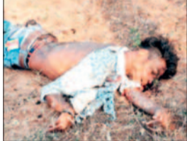
घायल युवती का इलाज जारी है।

शादीशुदा प्रेमिका पर ब्लेड से प्राणघातक हमला कर आरोपी युवक ने बिजली के खंभे में चढ़कर अपनी जान दे दी। जिले के बसना थाना क्षेत्र अंतर्गत ग्राम गढ़कुलझर में हुई इस घटना के बाद घायल युवती का इलाज जारी है। मिली जानकारी के अनुसार, युवती की शादी महज 15 दिन पहले ही हुई थी। शादी के बाद वह अपने पति के साथ नवरात्रि मेला देखने मायके गढ़कुलझर पहुंची थी। इसी दौरान उसका पुराना प्रेमी भी गांव पहुंच गया। दोनों रात्रि करीब 2-3 बजे दोनों घर से कुछ दूरी पर मिले, जहां किसी बात को लेकर दोनों के बीच विवाद हो गया। विवाद के दौरान युवक ने गुस्से में आकर ब्लेड से युवती के गले पर हमला कर दिया, जिससे वह गंभीर रूप